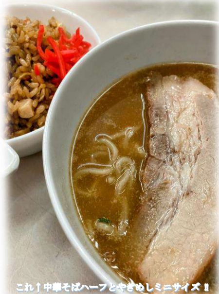
これ！中華そばハーフとやきめしミニサイズ！