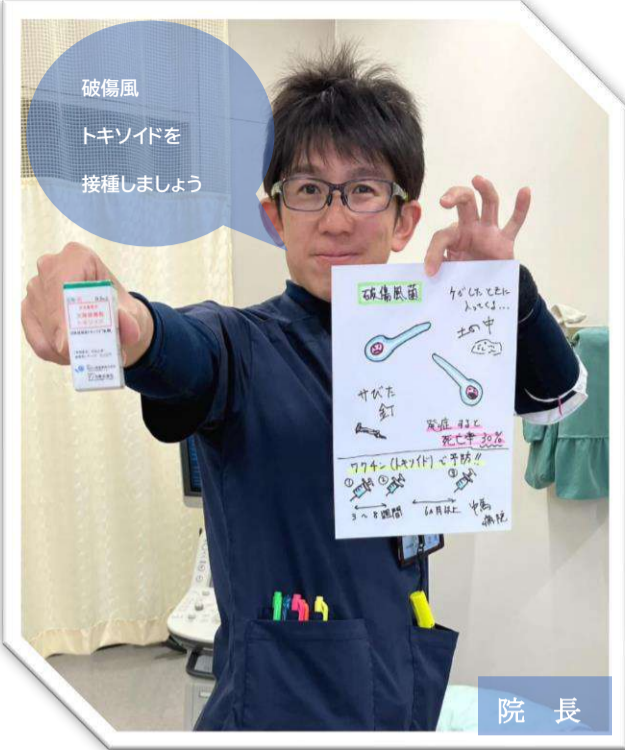
破傷風トキソイドを接種しましょう

破傷風トキソイド（破傷風ワクチン）は、破傷風菌が作り出す神経毒素への抵抗力身に付けさせてくれます。 ・釘や金属片を扱う業者の方。 ・土壌と頻繁に接する農業従事者の方。 ・同じく園芸家、造園業者の方。 ・動物に関わる職業の方。 命に係わる破傷風を予防するために、トキソイドを接種しましょう。ちなみに2回接種で抗体がで