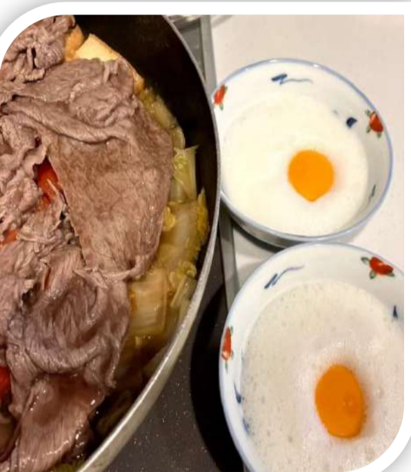
トマトすき焼き☆甘辛なたれと酸味、そしてメレンゲでいただく☆

■トマトすき焼き トマトすき焼きが美味しいと聞き、やってみました☆ これは美味しい！赤い彩がプラスされ、甘辛のたれとトマトの酸味がアクセントになる☆また、トマトに含まれるリコピンは、過熱により吸収率が高まるのです。ヘルシーかつ満足感。オシャレに卵は白身をメレンゲに☆(これがまた、お肉と絡み、何とも言えないまるやかさ) 締めはチーズリゾットで☆最後まで満足、そして満腹なり