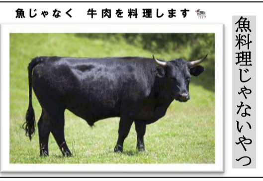
魚じゃなく 牛肉を料理します