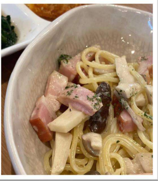
キノコとベーコンのクリームパスタ